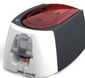
Stampante per tessere Badgy