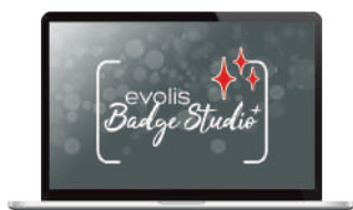
Software per la progettazione di tessere Evolis Badge Studio®